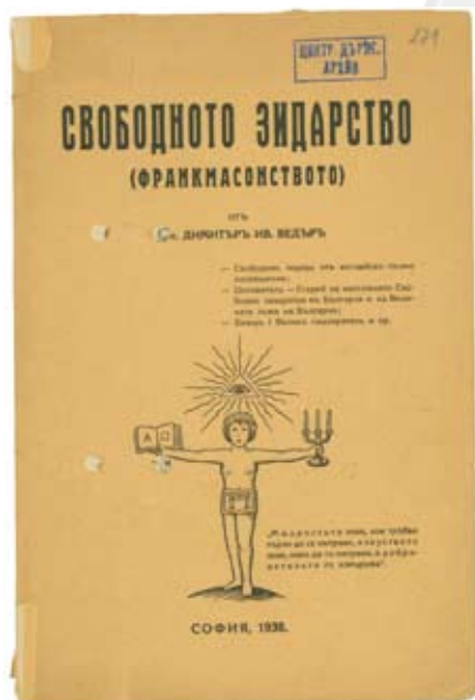
Книгата на Димитар Ведар „Свободното зидарство“. 1938 г.