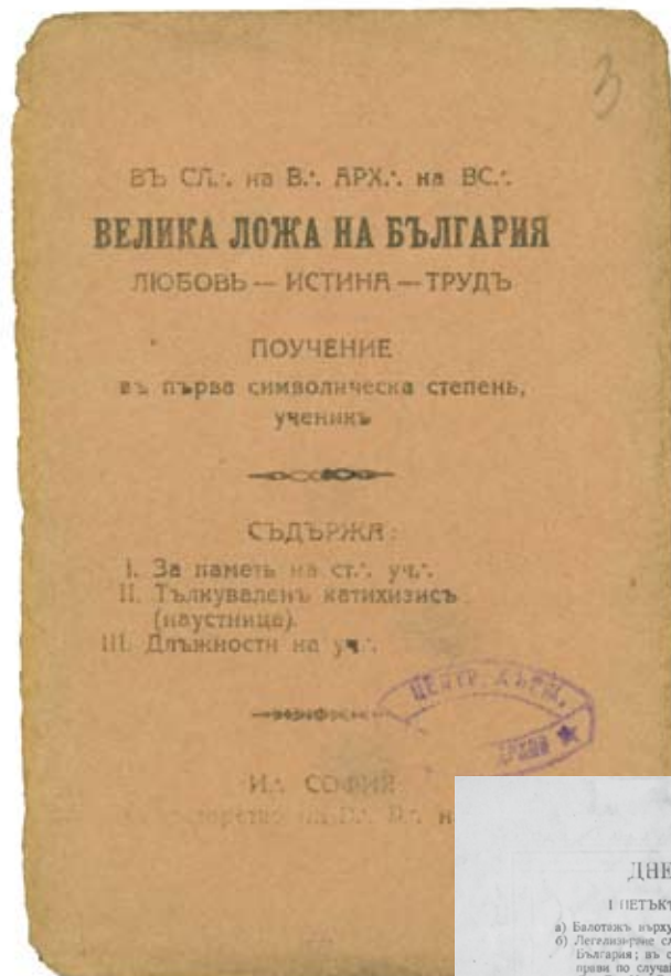
Скрипта со поуки за учениците на првиот степен.