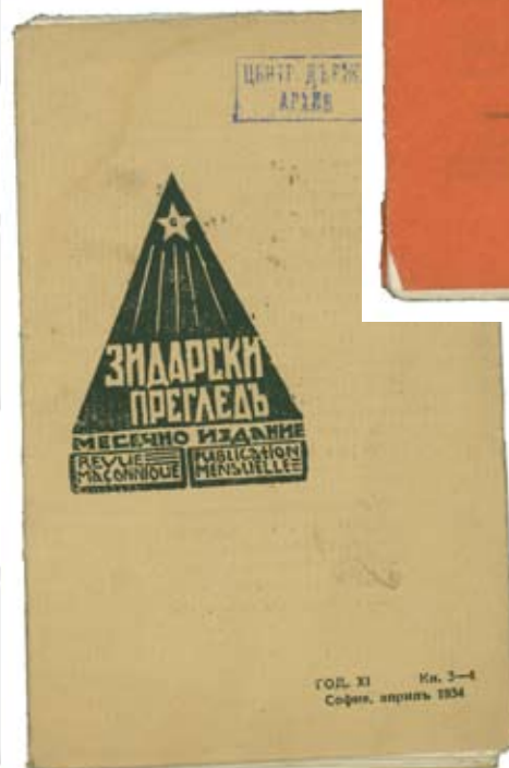
Списание „Зидарски преглед“ Софија 1933 и 1934 г.